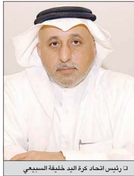
رئيس اتحاد كرة اليد خليفة السبيعي

وقد اختير خليفة عبدالله السبيعي ممثلاً عن منطقة الخليج والشرق الأوسط نظراً لشخصيته المرموقة والمعروفة، فهو أحد الكفاءات القطرية التي أُنبتت مكانتها على ساحة العطاء الرياضي والمهني في دولتنا الحبيبة قطر، حيث لم يأت هذا الاختيار من